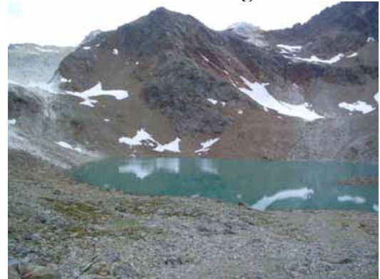
il secondo lago

DISLIVELLI : primo giorno + m 1160; secondo giorno – m 468; + m 577 – m 1269.