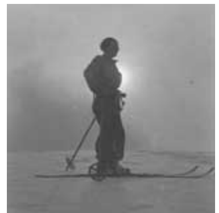
Emblematico e suggestivo esempio di altri tempi. Marzo 1935

A tutti i partecipanti, all'atto dell'iscrizione, verrà consegnato un portachiavi con il logo della SEM.