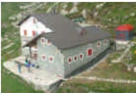
ZAMBONI - ZAPPA - 2.070 m Alpe Pedriola Macugnaga - VB tel. 0324.65313

A. OMIO - 2.100 m Alpe dell' Oro Valmasino - SO tel. 0342.640020