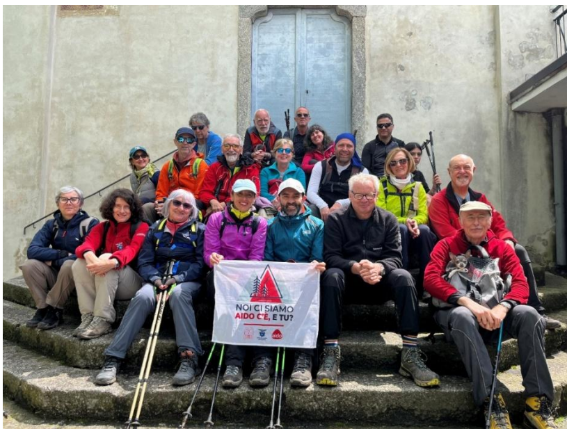
Sulla scalinata della chiesetta presso l'Eremo del M.Barro.