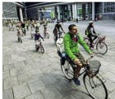
Piazza Lombardia | partecipanti a «BiciCivica»